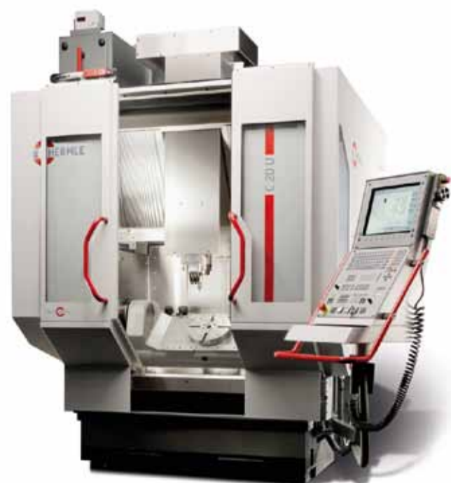
Auf dem 5-Achsen-Bearbeitungszentrum C20U von Hermle findet die Fertigung komplexer Einzelteile statt.