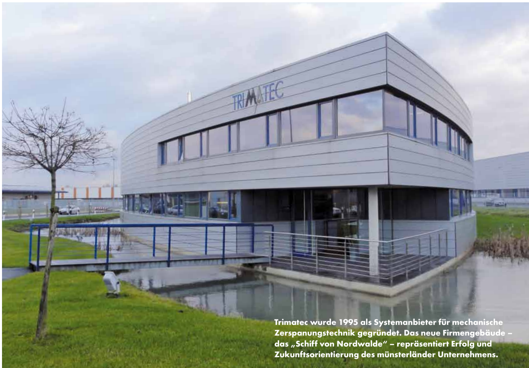
Trimatec wurde 1995 als Systemanbieter für mechanische Zerspanungstechnik gegründet. Das neue Firmengebäude – das „Schiff von Nordwalde“ – repräsentiert Erfolg und Zukunftsorientierung des münsterländer Unternehmens.